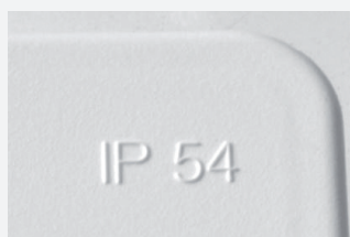
Duża szczelność IP 54