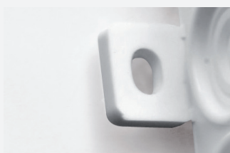
Uchwyty do mocowania pozwalające na poziomowanie puszki